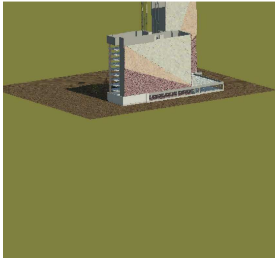
3 - 3