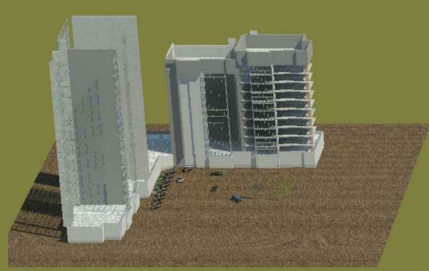
2 - 2