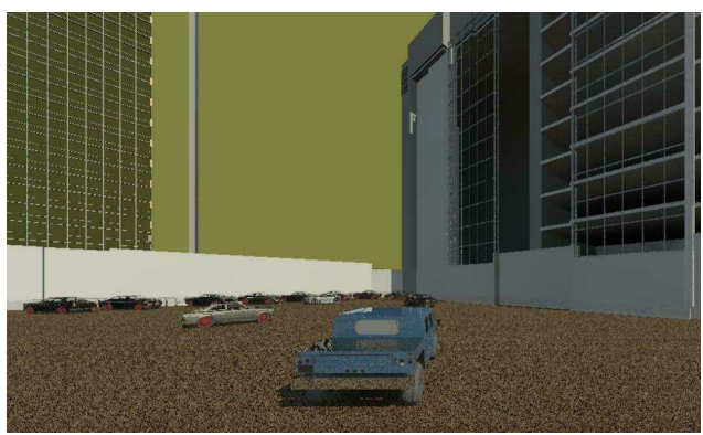
9 - 9