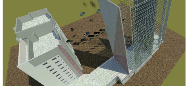
4 - 4