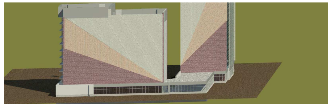
8 - 8