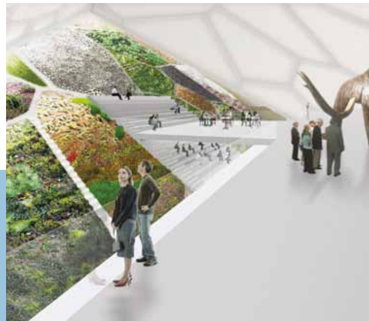
> Competition project of World Mammoth + Permafrost Museum Russia by LEESER Architecture, 2007 Конкурсный проект Всемирного музея мамонта и вечной мерзлоты в Якутске бюро LEESER Architecture, 2007 г.

Главная интрига конкурса заключалась в отказе жюри от изначальной идеи уральского «нового Бильбао». Самый авторитетный из участников «судейской коллегии», Петер Цумтор, с самого начала осудил желание основных заказчиков взять за образец «музей-аттракцион» гуггенхаймовского типа