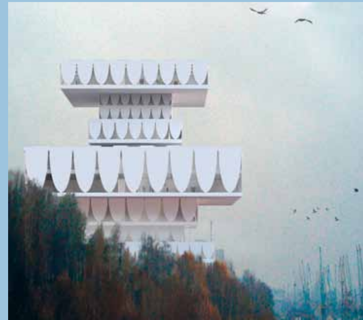
▲ Wining project in the competition for the new building of Perm Art Gallery by Valerio Olgiati Проект-победитель в конкурсе на новое здание Пермской художественной галереи авторства Валерио Ольджати

Another weapons city, Izhevsk, has got its museum laying claim to the status of signal landmark in 2004. Named after M. T. Kalashnikov, the designer of the world-known submachine-gun, the museum is devoted to the 200-year history of weapons-making in the Udmurt Republic. The